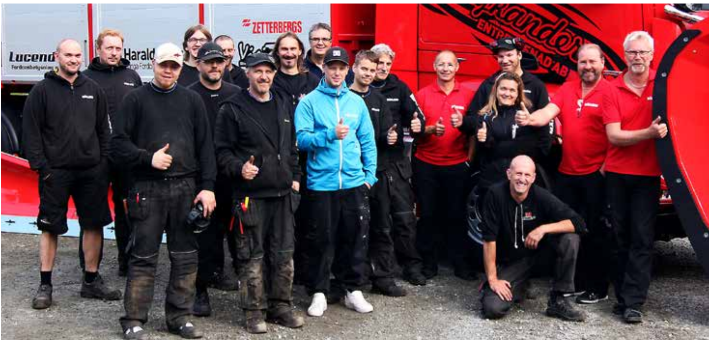
Du er alltid velkommen til teamet på hovedkontoret i Rossön, som utvikler, designer, bygger, drifter og selger Mählers produkter.

Det er en fantastisk herlig atmosfære i Rossön på Mählers' fabrikk, og man kjenner seg alltid veldig velkommen