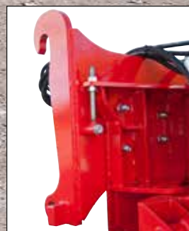
Mählers grusstrengspreder tilbyr mange justeringsmuligheter, slik at resultatene skal bli perfekt