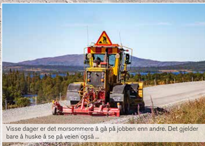
Visse dager er det morsommere å gå på jobben enn andre. Det gjelder bare å huske å se på veien også ...

OPPDRAGENE er veldig variert – det kan være alt fra legging av en kraftledning over et fjell til en mindre tomtplanlegging.