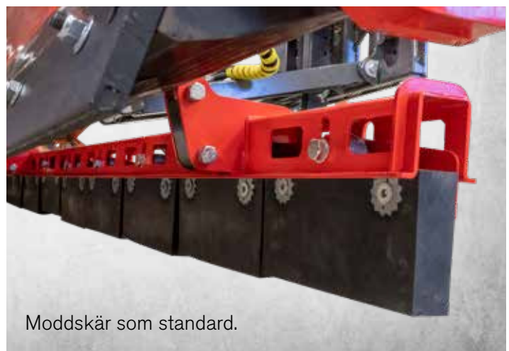
Moddskär som standard.