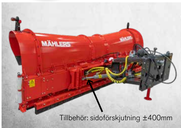
Tillbehör: sidoförskjutning \pm 400 mm